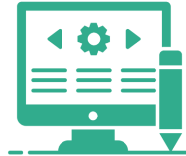
Banques de ressources